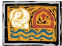
Diaconie Ontmoetingskerk Bergambacht

U kunt de bestelling doorgeven via dit online formulier. Bestelling doorgeven kan tot en met 27 december. Op naar een mooie opbrengst voor de Voedselbank IJssel en Lek!