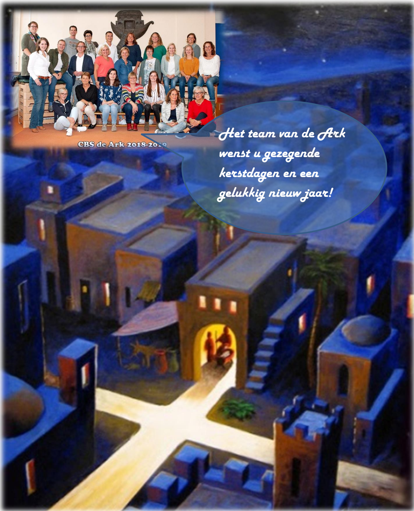
CBS de Ark 2018-2019

Het team van de Ark wenst u gezegende kerstdagen en een gelukkig nieuw jaar!